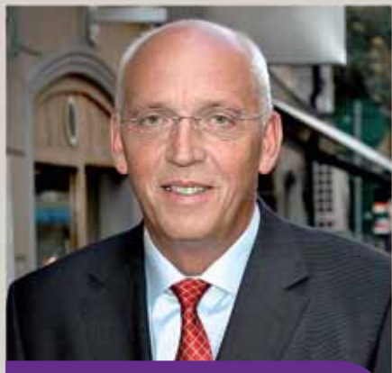
Ларс Ниберг Президент и Генеральный Директор, TeliaSonera